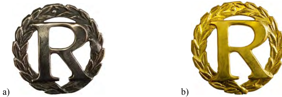
Rys. 1. Wzór oznaki identyfikacyjnej: